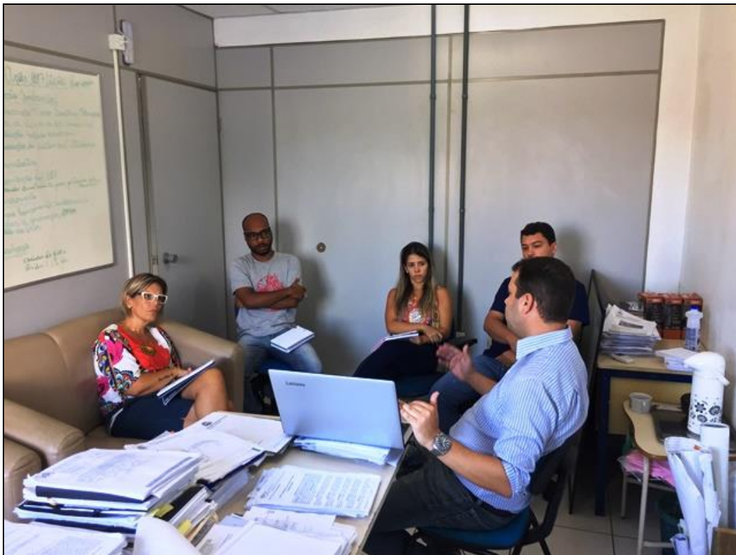
Figura 2 – Participação dos membros do Comitê Diretor da oficina (Meta 3)

A estruturação, organização, condução, logística, definição de local e funcionamento da oficina foi de comum acordo entre a Consultora e o Comitê Diretor Local. A lista de presença e a ata do evento podem ser visualizadas, respectivamente, no Anexo 3 e no Anexo 4.