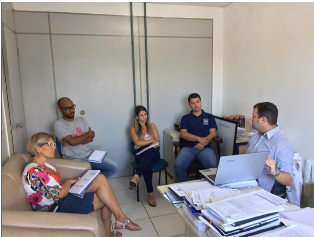
Figura 1 – Apresentação da oficina (Meta 3) pela Empresa Premier Engenharia

A apresentação dos conteúdos técnicos foi realizada por meio de software (PowerPoint) e formatada de modo a facilitar a compreensão dos participantes (ver Anexo 2).